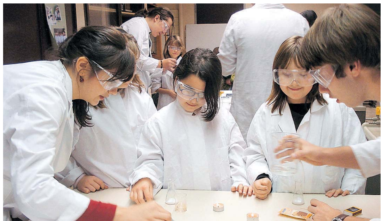
Oberstufenschüler experimentieren zusammen mit Viertklässlern.